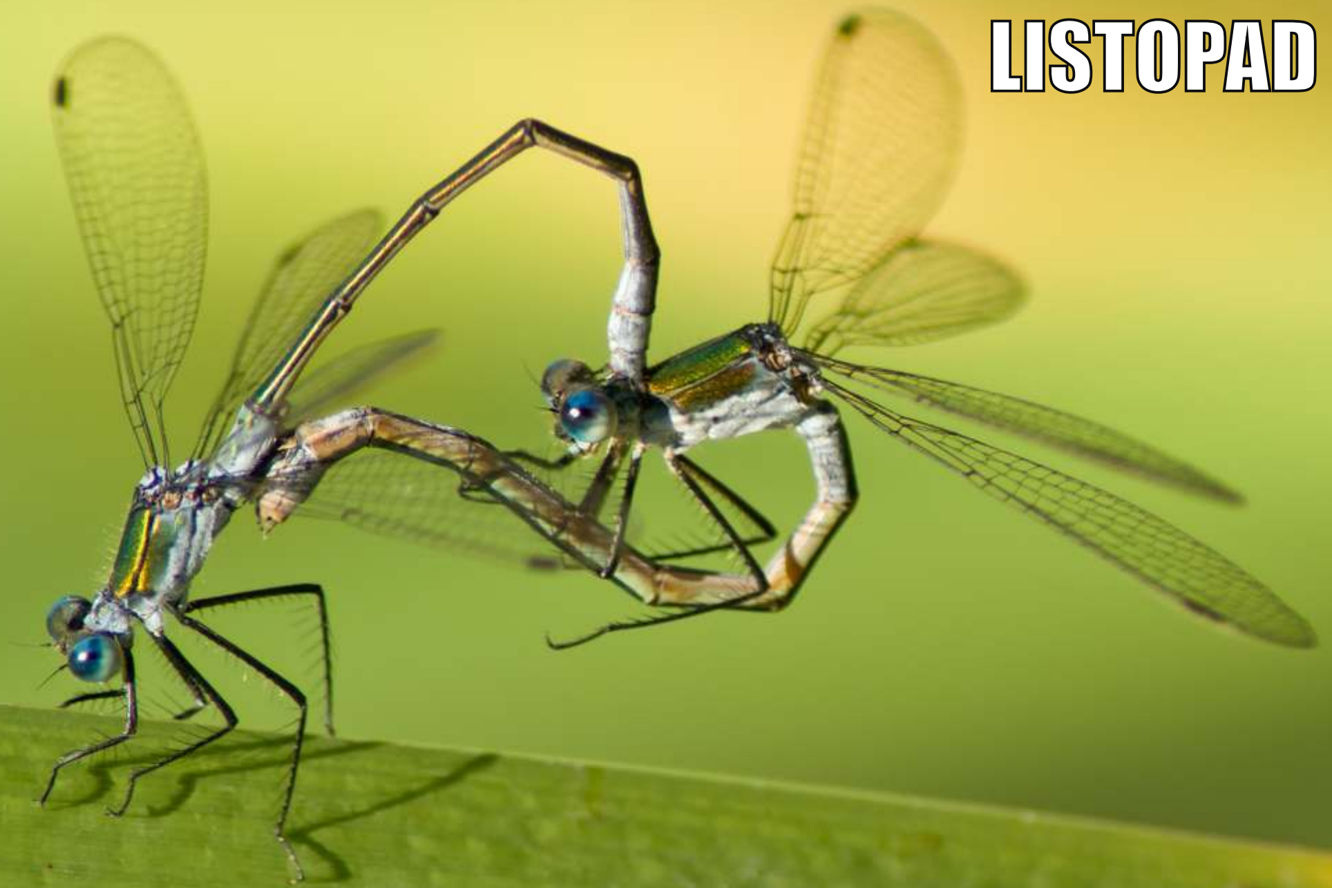
Pałątka pospolita Lestes sponsa (para)

1 2 3 4 5 6 7 8 9 10 11 12 13 14 15 16 17 18 19 20 21 22 23 24 25 26 27 28 29 30