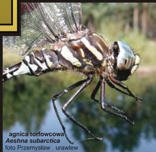
agnica torfowcowa Aeshna subarctica