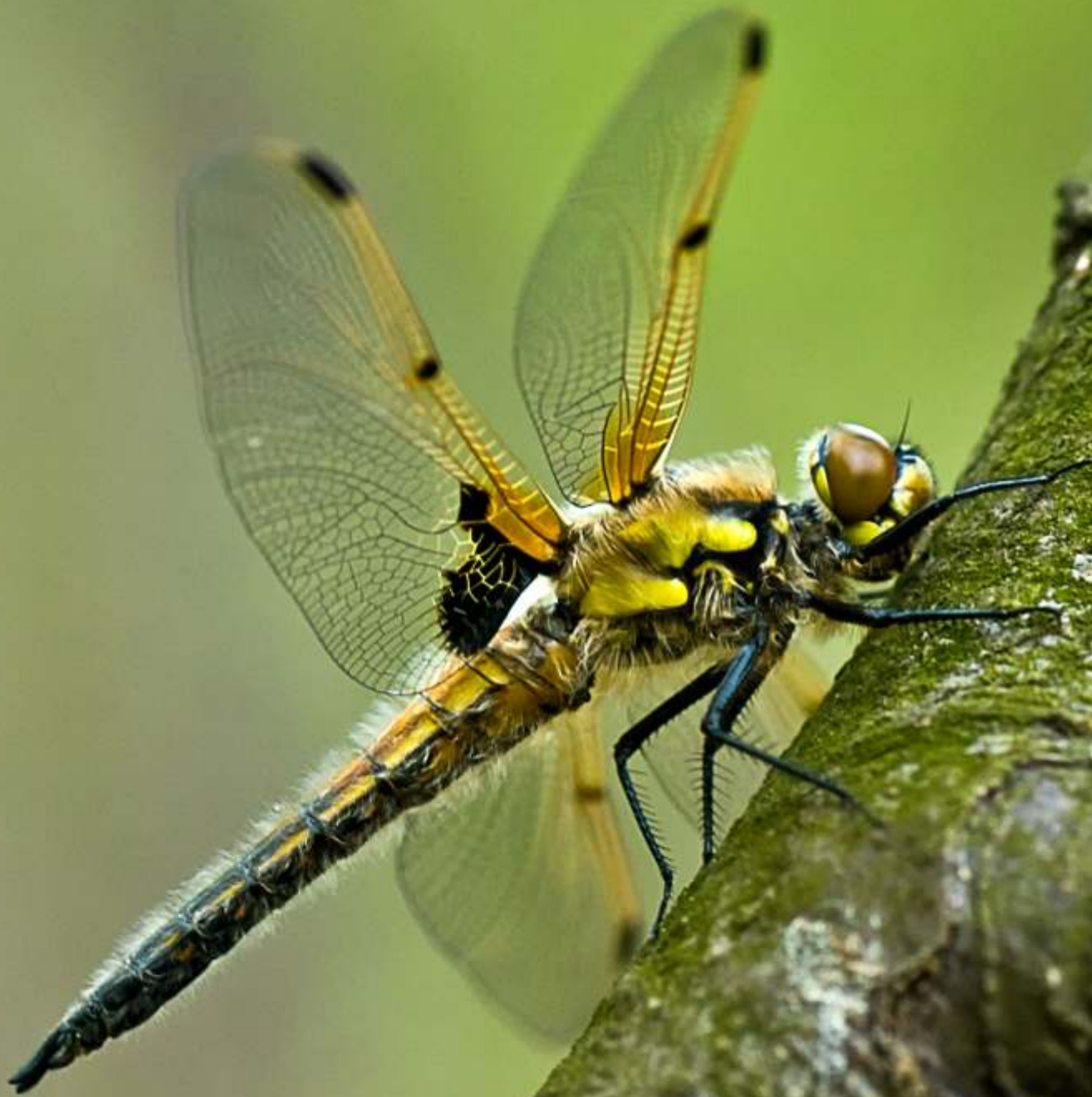
Ważka czteropłama Libellula quadrimaculata (samiec)

1 2 3 4 5 6 7 8 9 10 11 12 13 14 15 16 17 18 19 20 21 22 23 24 25 26 27 28 29 30 31