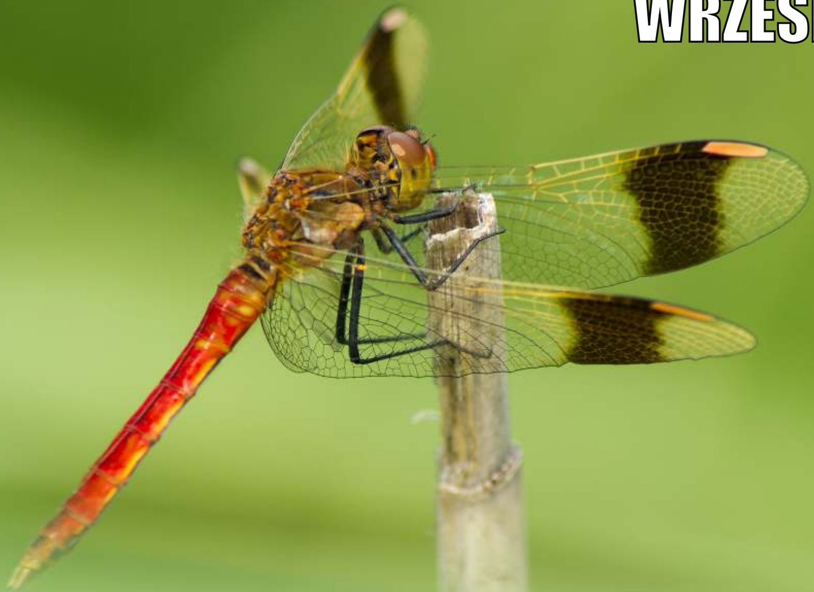
Szablak przepasany Sympetrum pedemontanum (samiec)

1 2 3 4 5 6 7 8 9 10 11 12 13 14 15 16 17 18 19 20 21 22 23 24 25 26 27 28 29 30