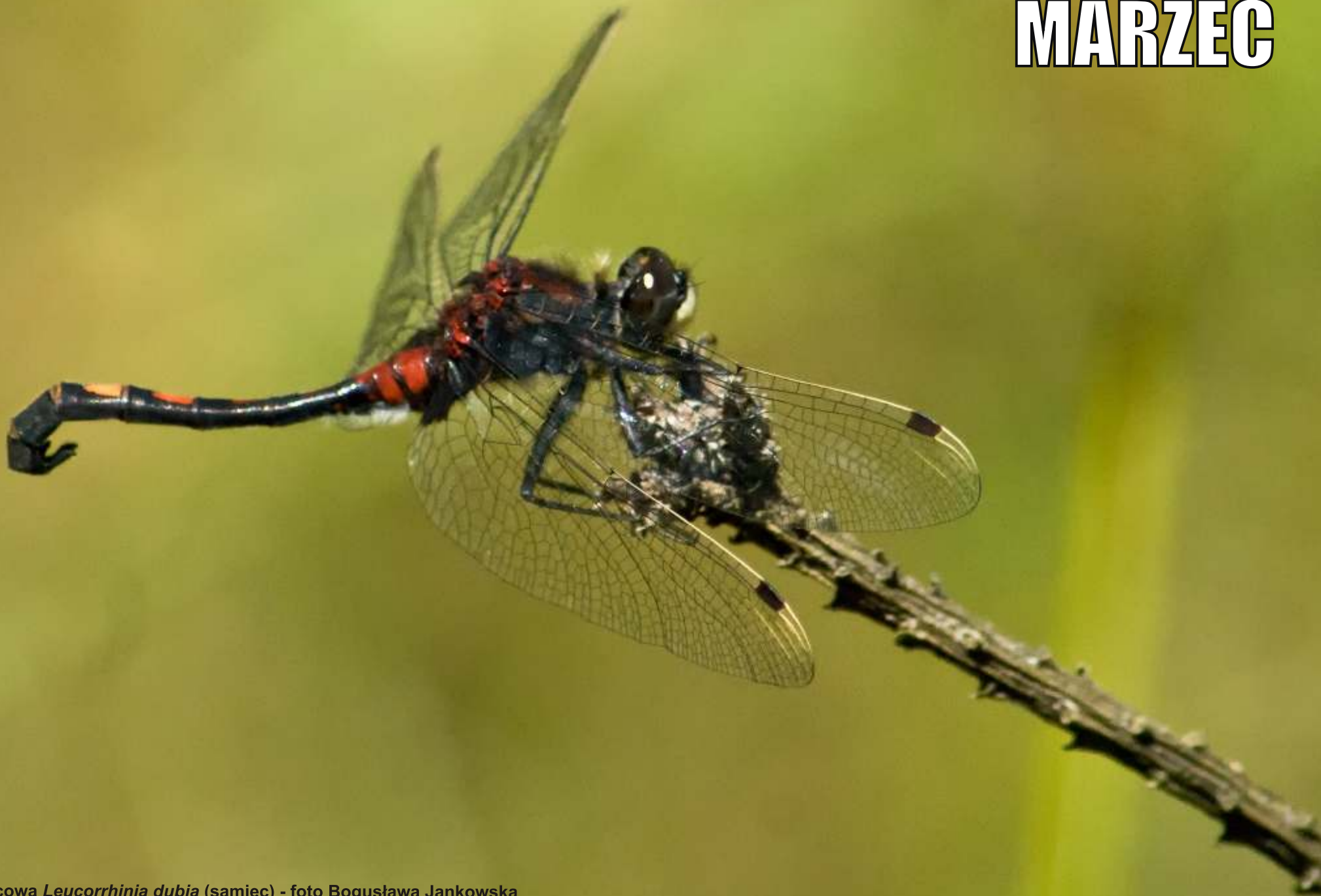
Zalotka torfowcowa Leucorrhinia dubia (samiec)

1 2 3 4 5 6 7 8 9 10 11 12 13 14 15 16 17 18 19 20 21 22 23 24 25 26 27 28 29 30 31