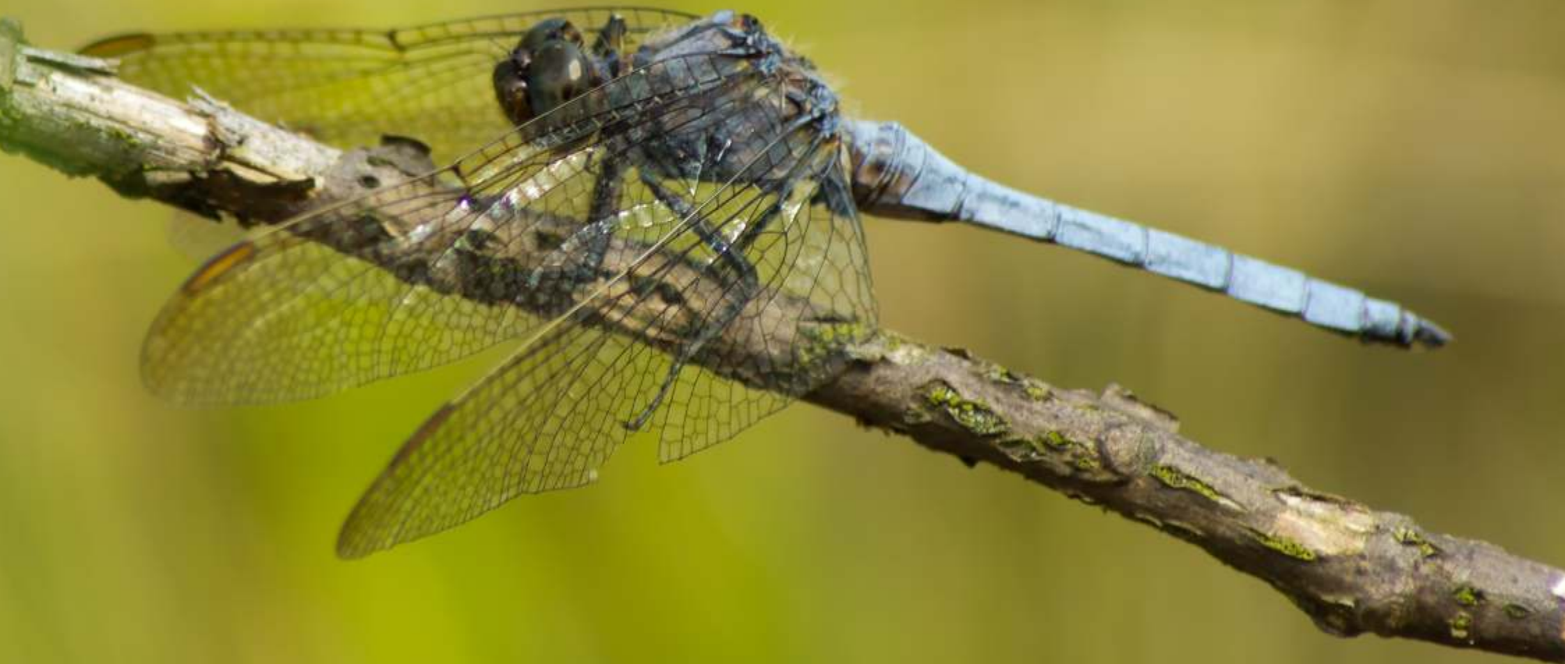
Lecicha południowa Orthetrum brunneum (samiec)

1 2 3 4 5 6 7 8 9 10 11 12 13 14 15 16 17 18 19 20 21 22 23 24 25 26 27 28 29 30 31