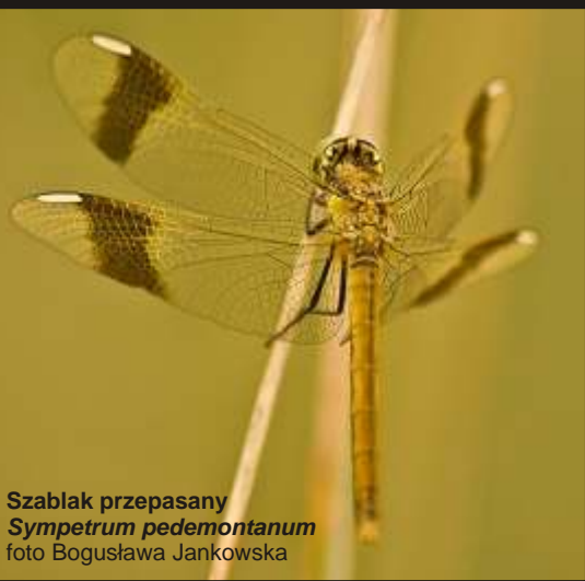
Szablak przepasany Sympetrum pedemontanum