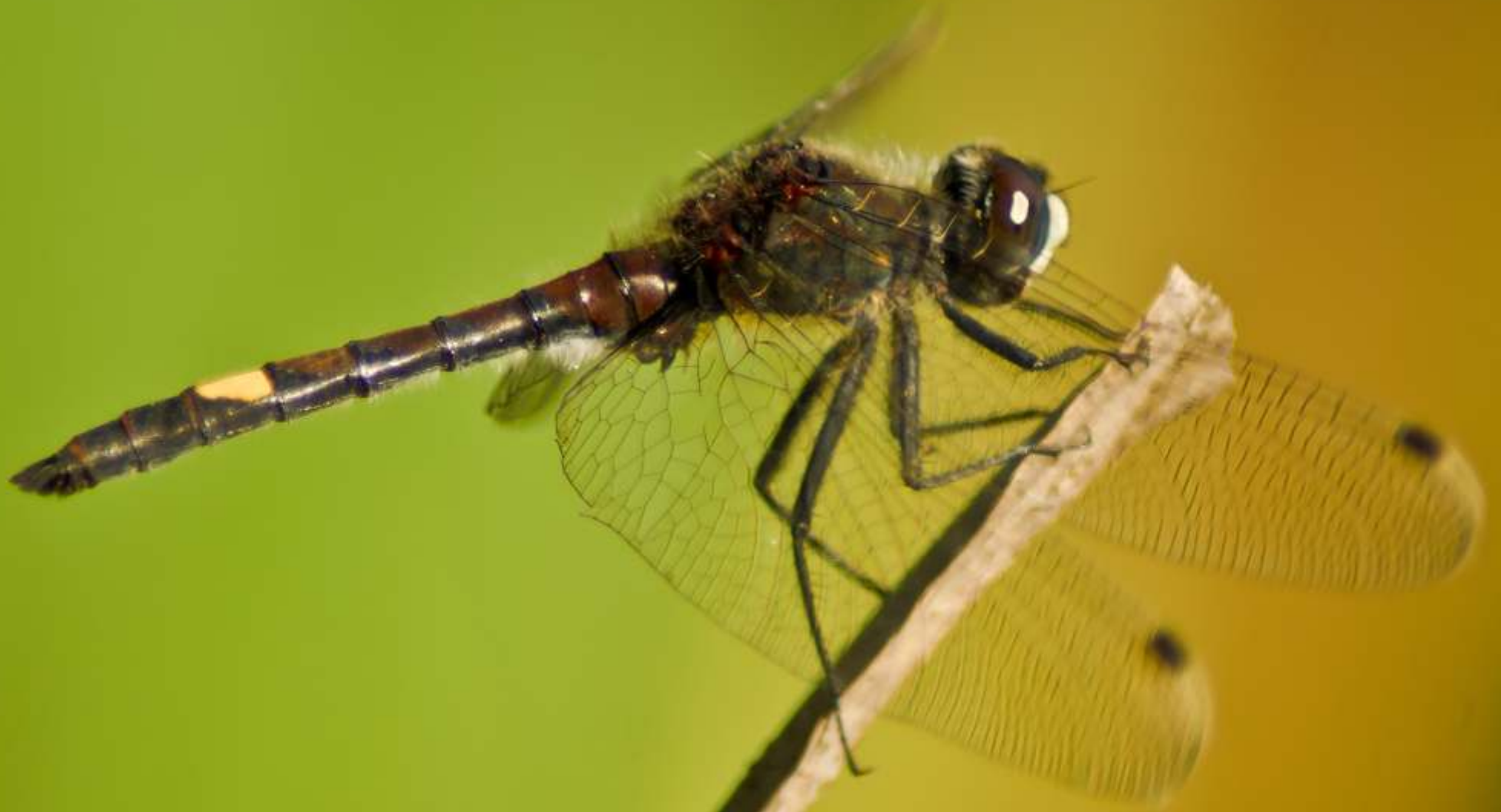
Zalotka większa Leucorrhinia pectoralis (samiec)

1 2 3 4 5 6 7 8 9 10 11 12 13 14 15 16 17 18 19 20 21 22 23 24 25 26 27 28 29 30 31