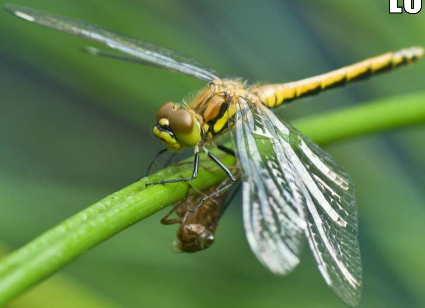
Szablak czarny Sympetrum danae (samica)

1 2 3 4 5 6 7 8 9 10 11 12 13 14 15 16 17 18 19 20 21 22 23 24 25 26 27 28 29