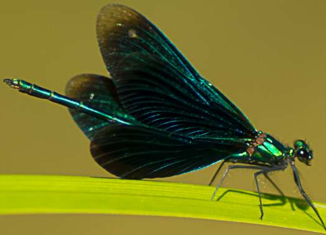
Świtezianka dziewica Calopteryx virgo (samiec)

1 2 3 4 5 6 7 8 9 10 11 12 13 14 15 16 17 18 19 20 21 22 23 24 25 26 27 28 29 30 31