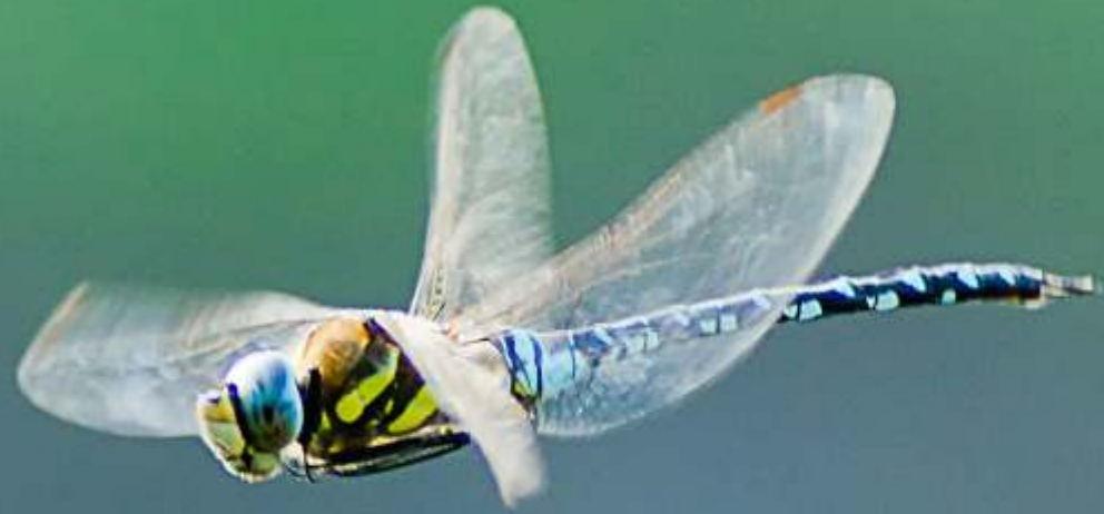
Żagnica jesienna Aeshna mixta (samiec)

1 2 3 4 5 6 7 8 9 10 11 12 13 14 15 16 17 18 19 20 21 22 23 24 25 26 27 28 29 30 31