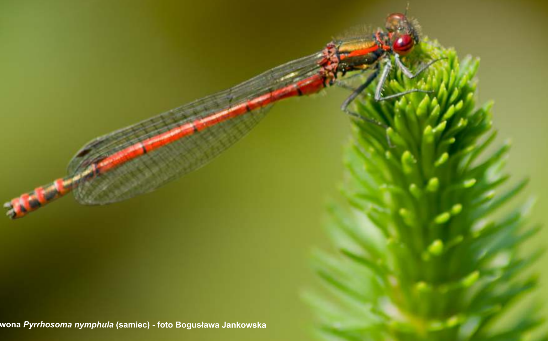
Łunica czerwona Pyrrhosoma nymphula (samiec)

1 2 3 4 5 6 7 8 9 10 11 12 13 14 15 16 17 18 19 20 21 22 23 24 25 26 27 28 29 30 31