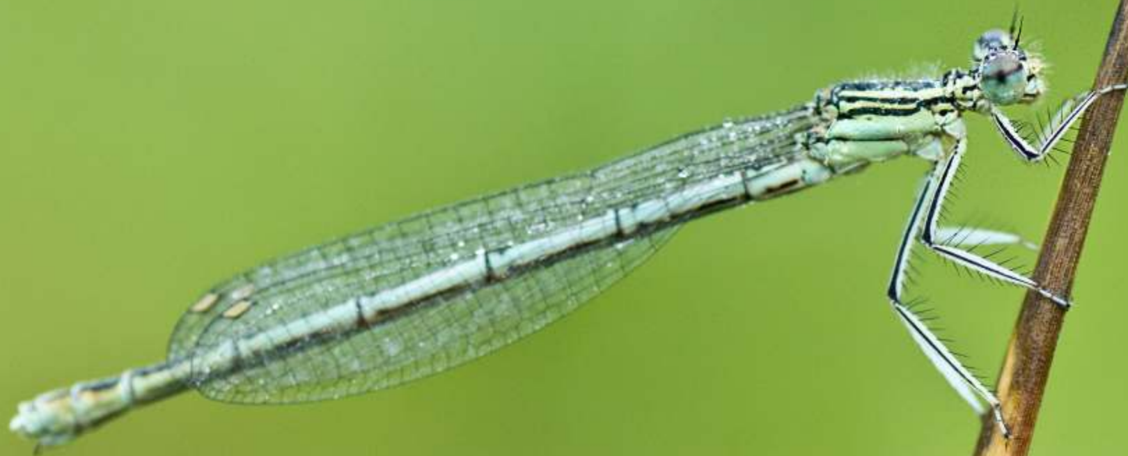
Pióronóg zwyczajny Platycnemis pennipes (samiec)

1 2 3 4 5 6 7 8 9 10 11 12 13 14 15 16 17 18 19 20 21 22 23 24 25 26 27 28 29 30