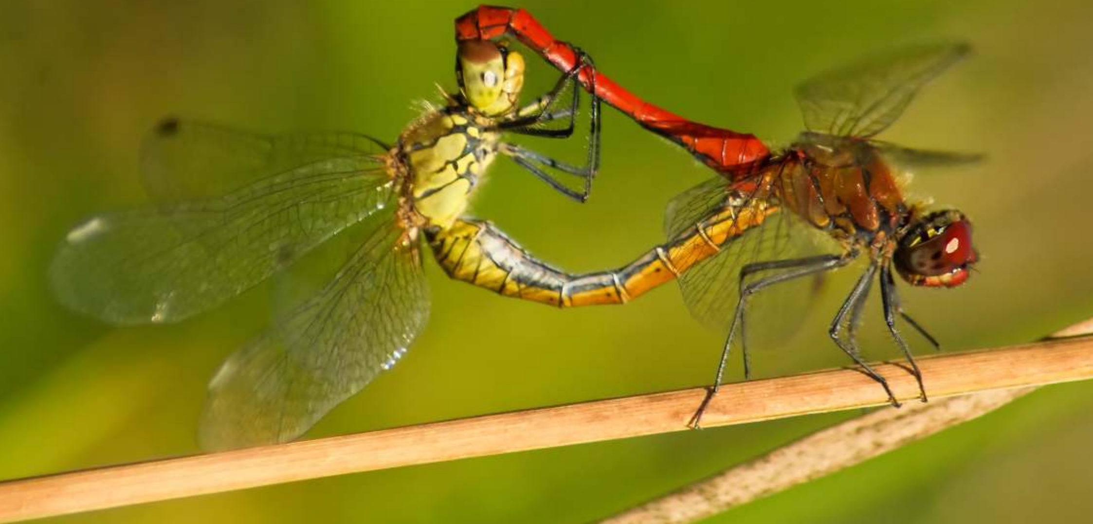
Szablak krwisty Sympetrum sanguineum (para)

1 2 3 4 5 6 7 8 9 10 11 12 13 14 15 16 17 18 19 20 21 22 23 24 25 26 27 28 29 30